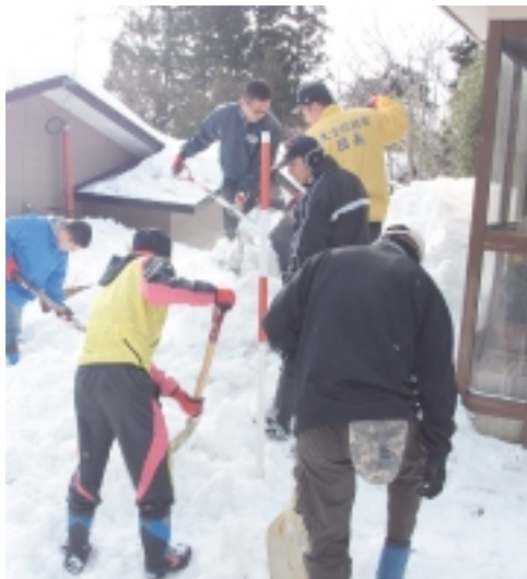
昨年の除雪ボランティア