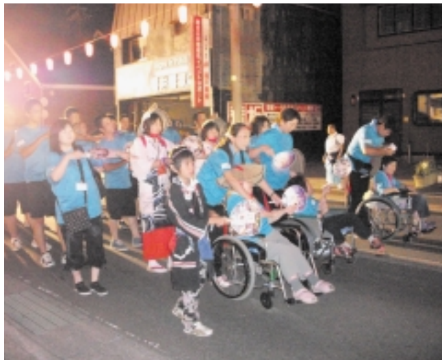
昨年のおしまこ流し踊り

本会では、高齢者や障がいを抱えた方の社会参加やバリアフリーの推進を目的に田名部まつり「おしまこ流し踊り」に昨年度から特別参加しております。 今年も左記のとおり参加者を募集いたしますので、お気軽に左記事務局までお問い合わせください。