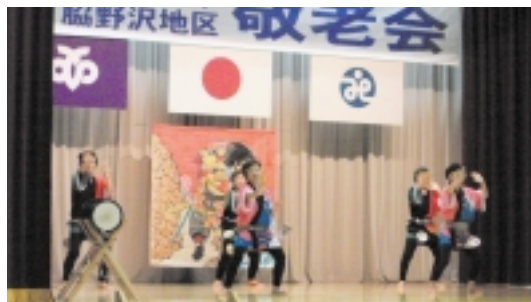
脇野沢地区敬老会