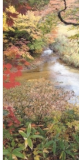
川内川渓谷コース

本会では、10月16日(木)、21日(火)の両日、参加者のリフレッシュと健康増進を目的に「溪流を散策しながら紅葉を楽しむ会」を今年度新規事業として実施いたしました。