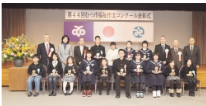
昨年の表彰式記念写真

入賞者への表彰式は、左記により実施し、当日は、入賞作品の朗読を行う予定としておりますので、皆様の御来場をお待ちしております。