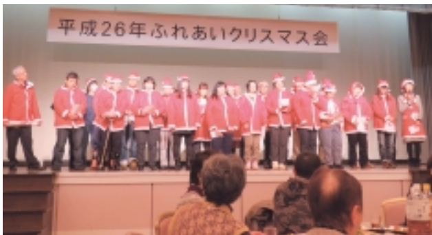
アクセス工房の皆様

高校生ボランティアからは、「普段、障がい者と接する機会が少なく、貴重な体験ができた。」と感想が寄せられました。