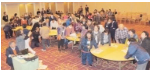
レクリエーションを楽しむ参加者