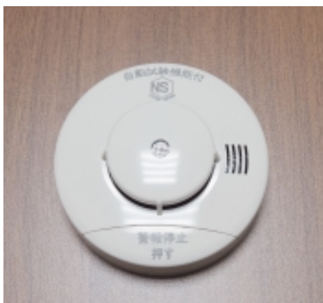
寄贈いただいた火災報知器

設置を終えた高齢者からは、「これで夜は安心して寝られる。」などの声が聞かれるなど、火災予防に有効に活用させていただいております。