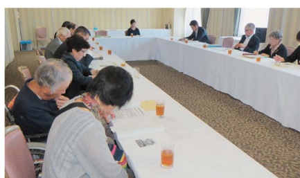
元気家族リフレッシュサロン