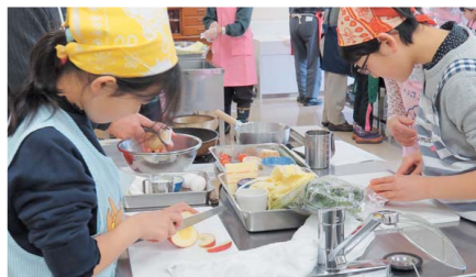
ほのぼの料理教室